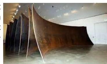
La matière du temps 1994-2005 Richard Serra. Musée Guggenheim, Bilbao

avant de recevoir le traitement de protection qui rendra le bac d'une couleur brune plus uniforme. "Ouf !", diront ceux qui ne semblent pas voir dans ces surfaces texturées des œuvres d'art contemporain à la Richard Serra ! Que cette jardinière extraordinaire permette aux promeneurs d'admirer les détails et les couleurs de ce microcosme fleuri et arborescent.