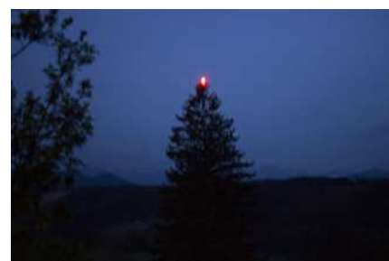
Une étoile rouge qui brille à 20h