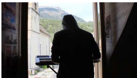
Musique au balcon