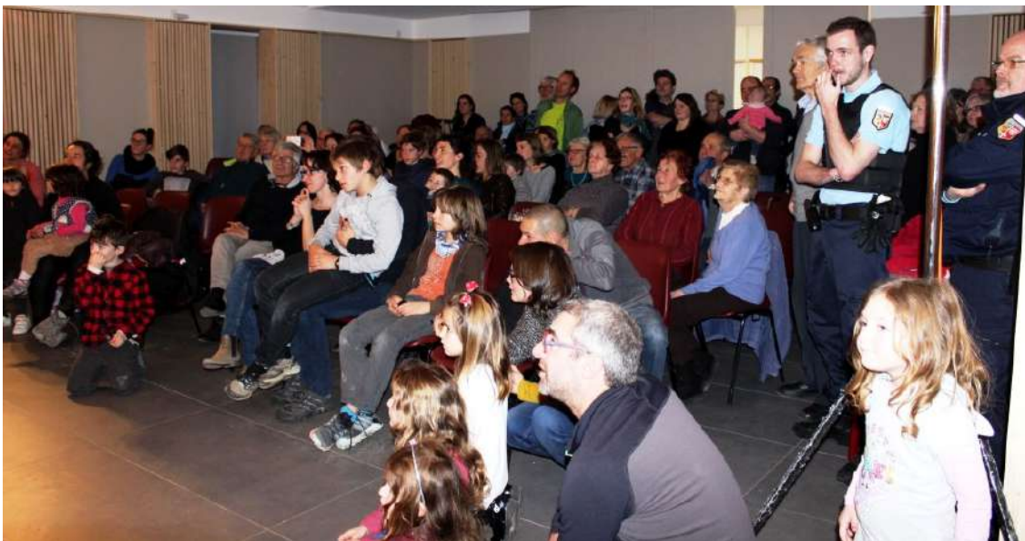
Une assemblée très attentive