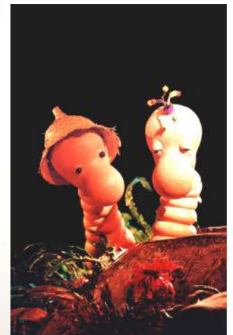
Les vers de terre sortent du Tas