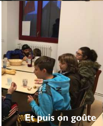
Et puis on goûte