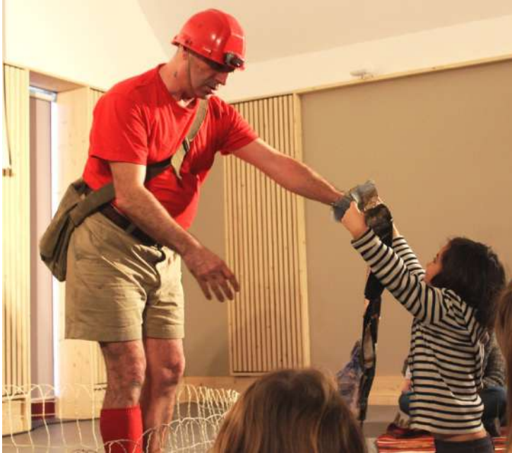
Spectacle « Le Tas », les enfants participent