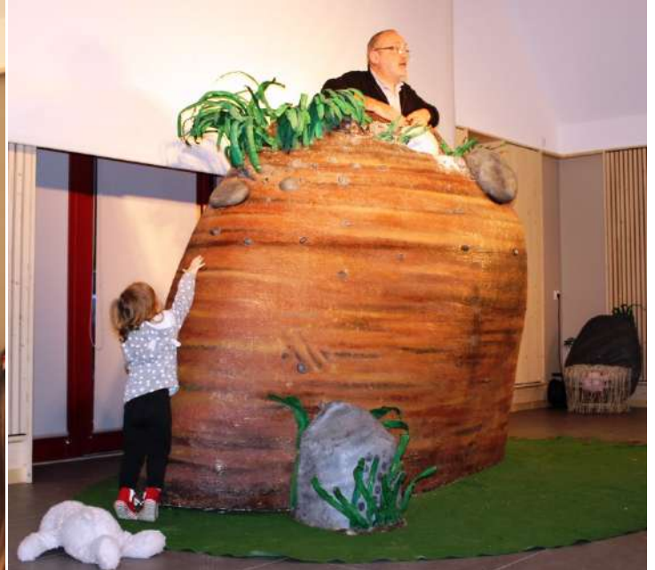
Présentation originale des vœux du maire