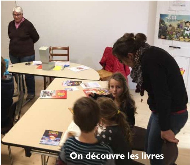
On découvre les livres