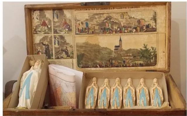
Objets de piété