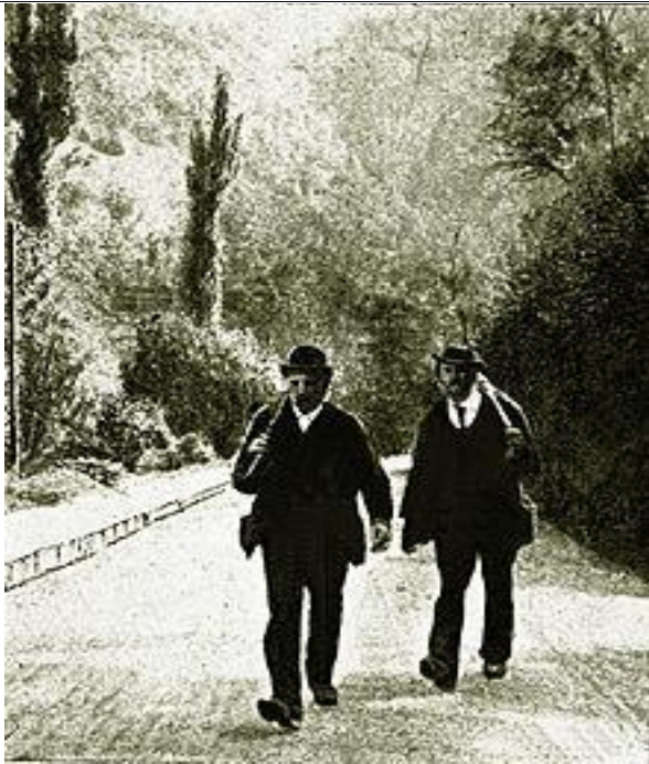
vers 1900