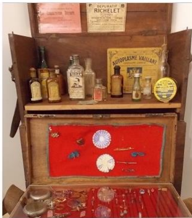
Remèdes et bijoux