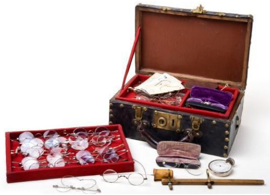
Marmotte de lunetier

"Marmotte" est un terme qui recouvre l'ensemble des bagages de professionnels destinés au transport d'échantillons, hier comme aujourd'hui pour le représentant de commerce.