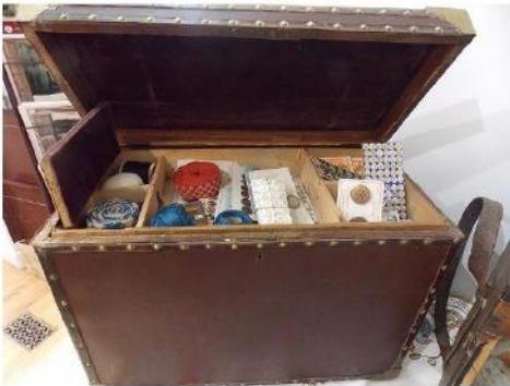
Marmotte de mercier

Chaque colporteur semblait se spécialiser peu ou prou. C'est dans la mercerie : boutons, rubans, fil, aiguilles, dés